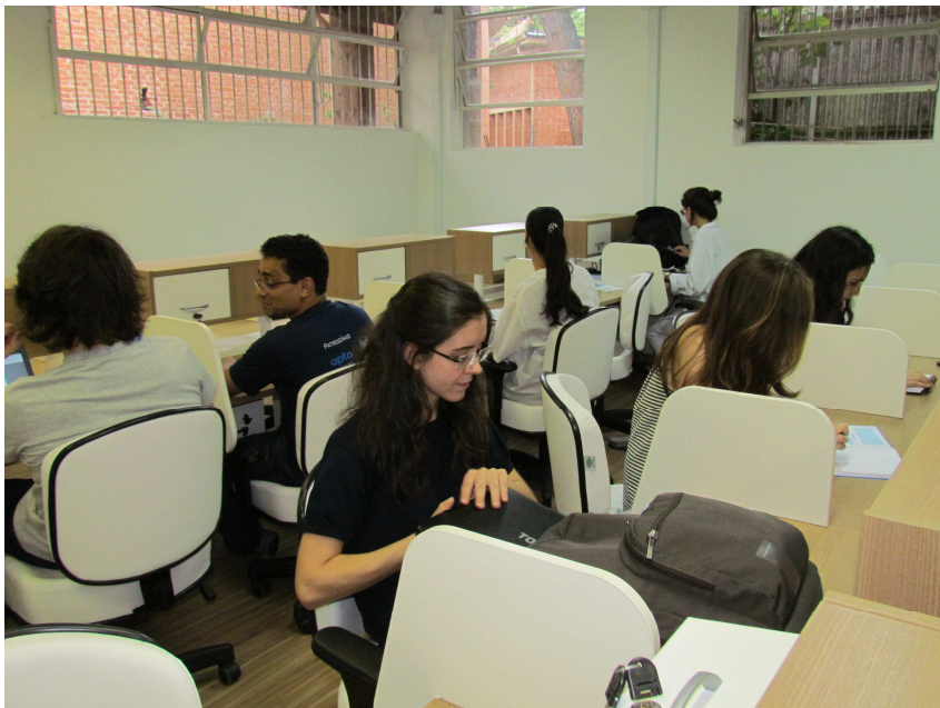
Estações de trabalho