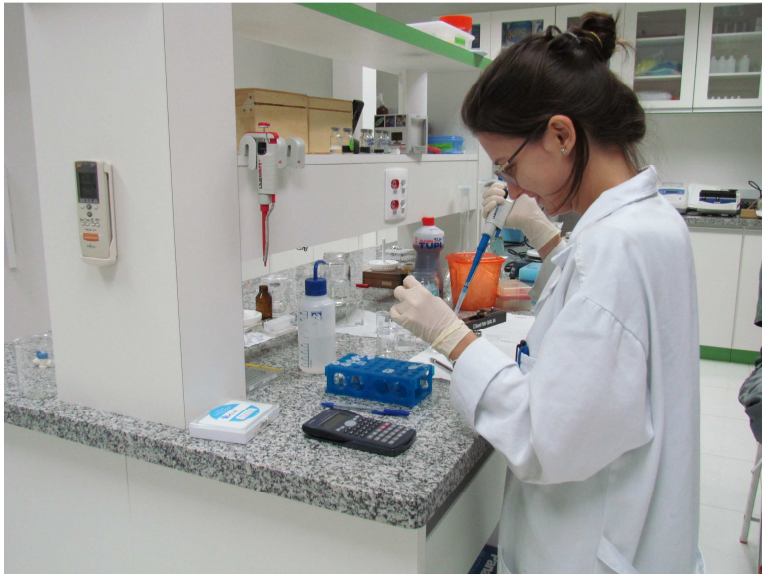
Laboratório de Síntese Química