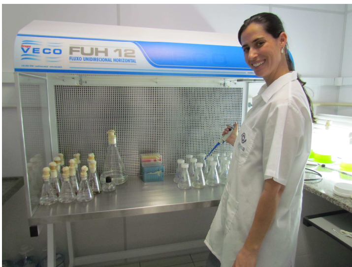
Laboratório de Ecotoxicidade