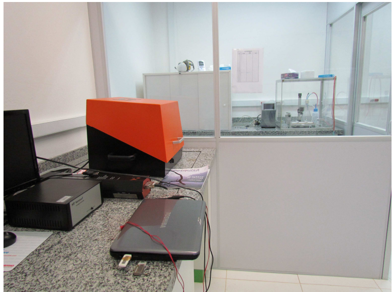
Laboratório de Microscopia de Força Atômica e Filmes Finos