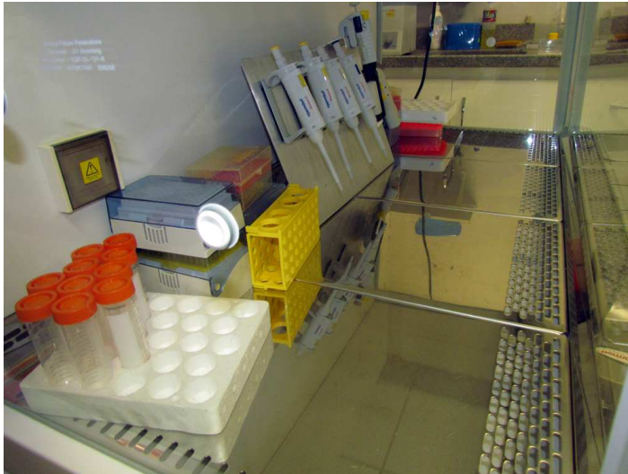
Laboratório de Biologia Celular