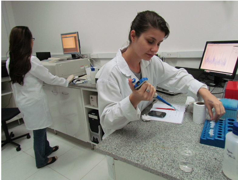
Laboratório de Espectroscopia e Citometria