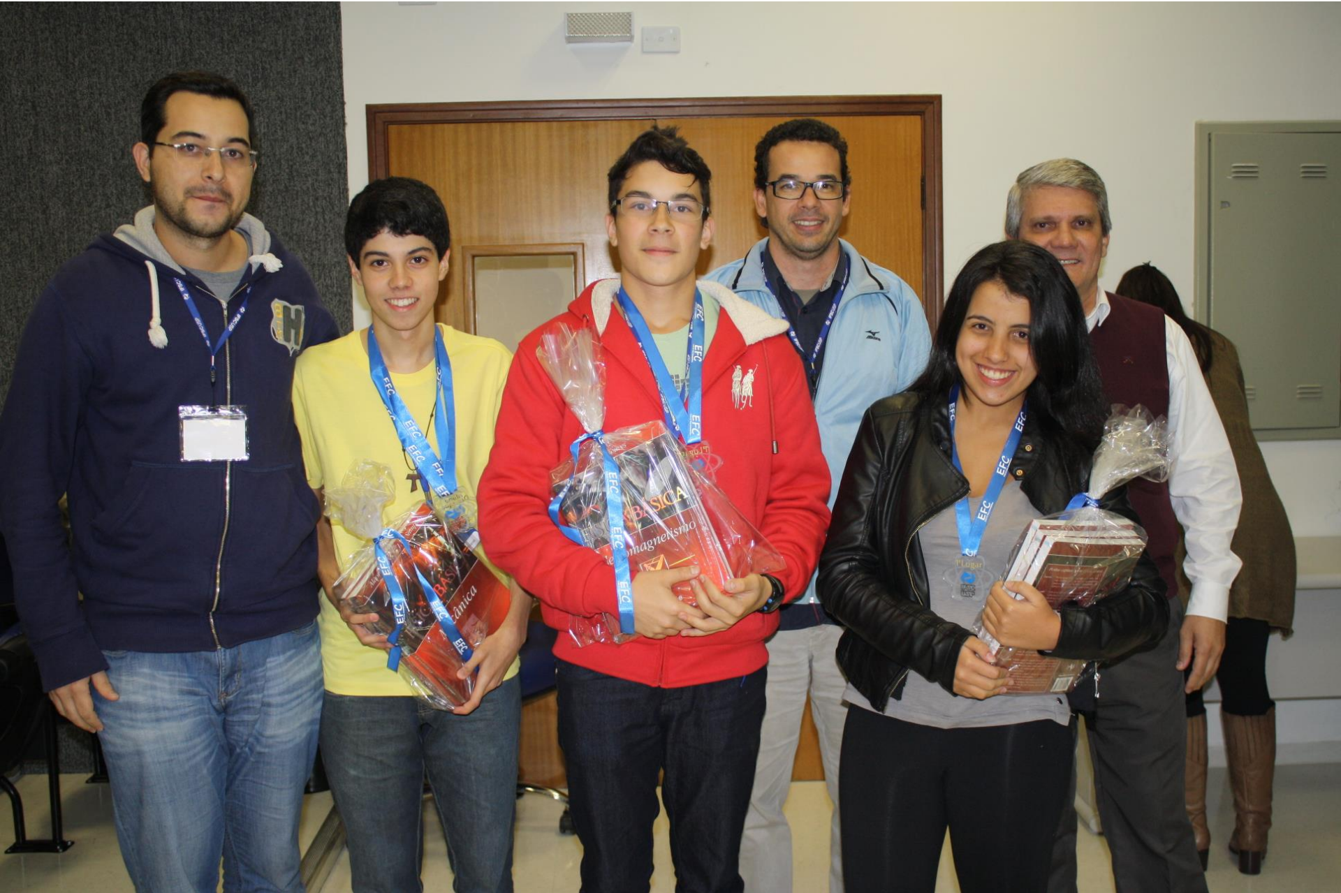
Melhor Grupo EFC 2013