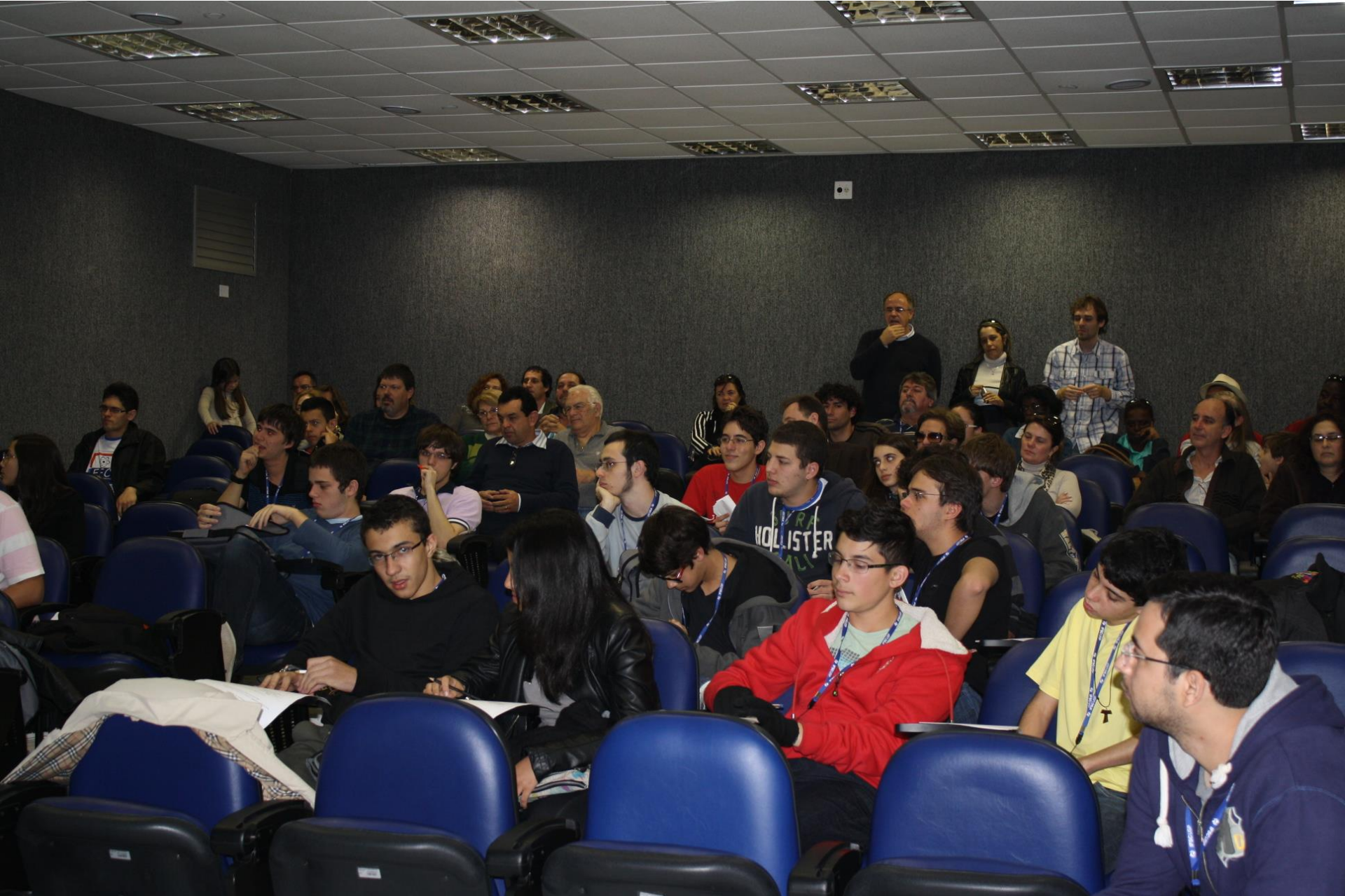
Anfiteatro Azul – LEF – IFSC Vista parcial da plateia - 1