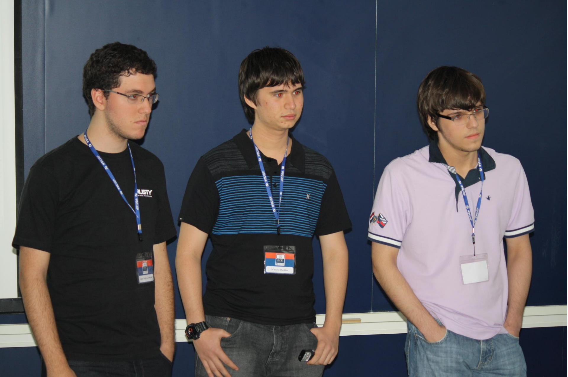
Seminário – 5 Efeito Hall