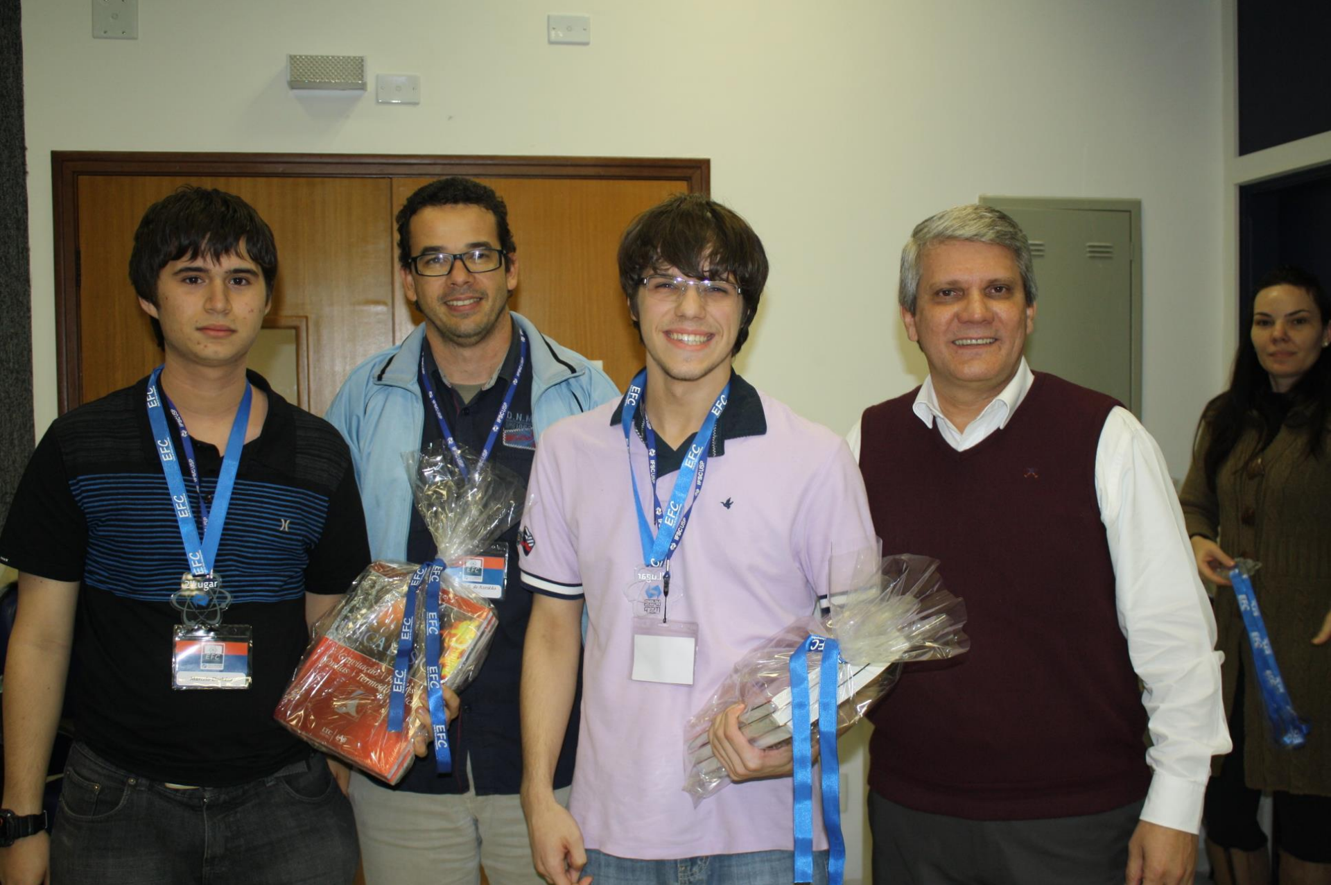
2º Melhor Grupo EFC 2013