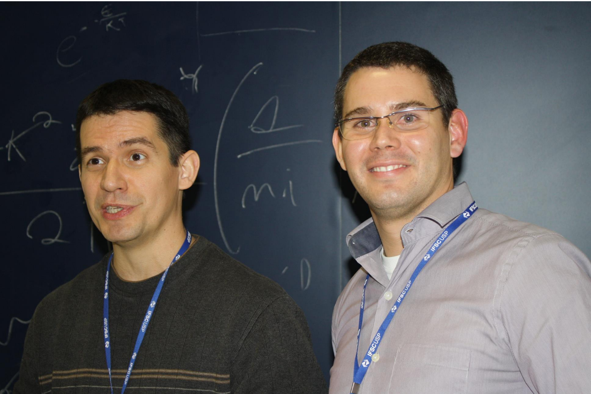
Satisfação na hora da despedida Até 2014