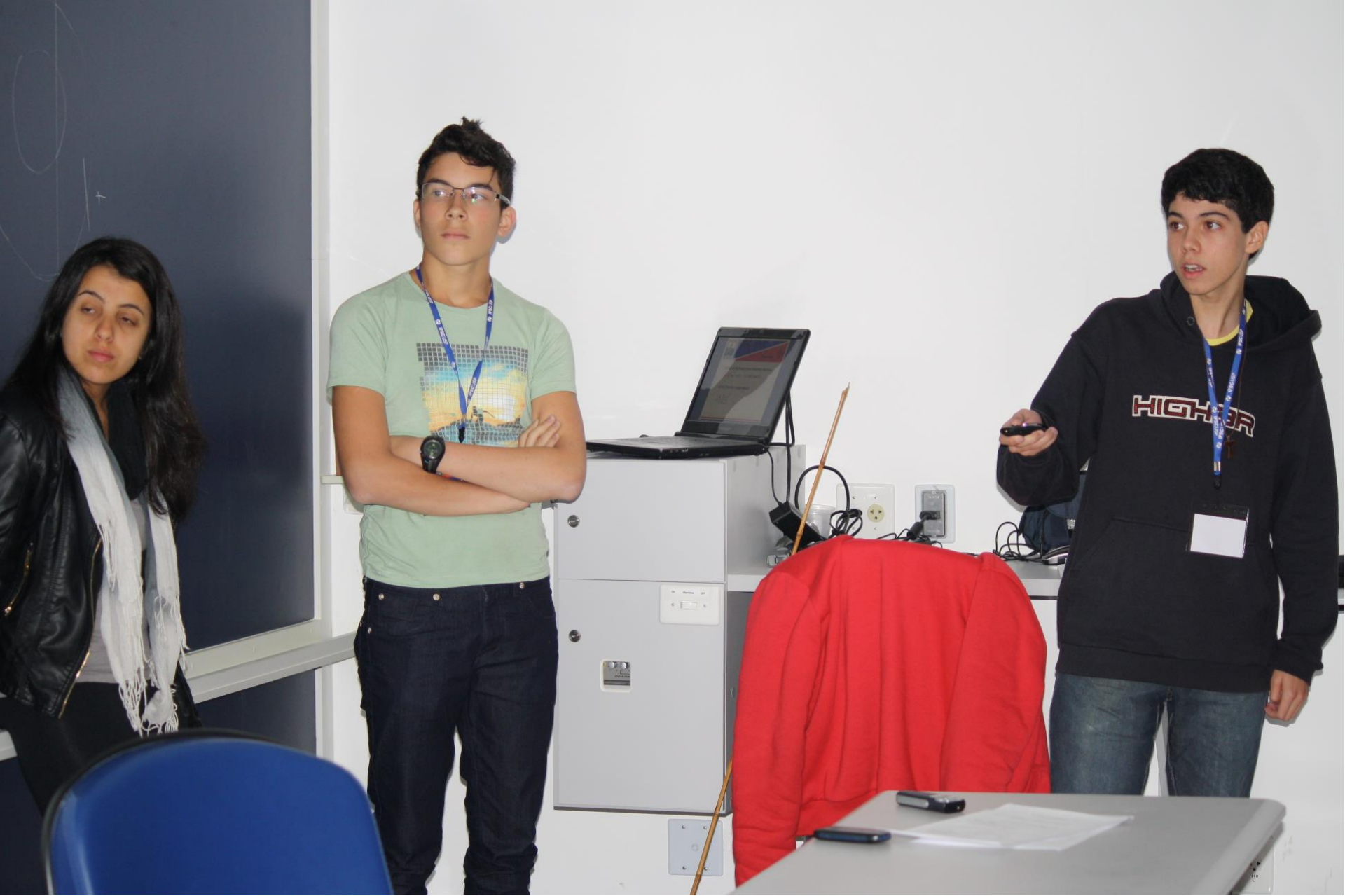
Seminário – 4 Efeito Termoiônico