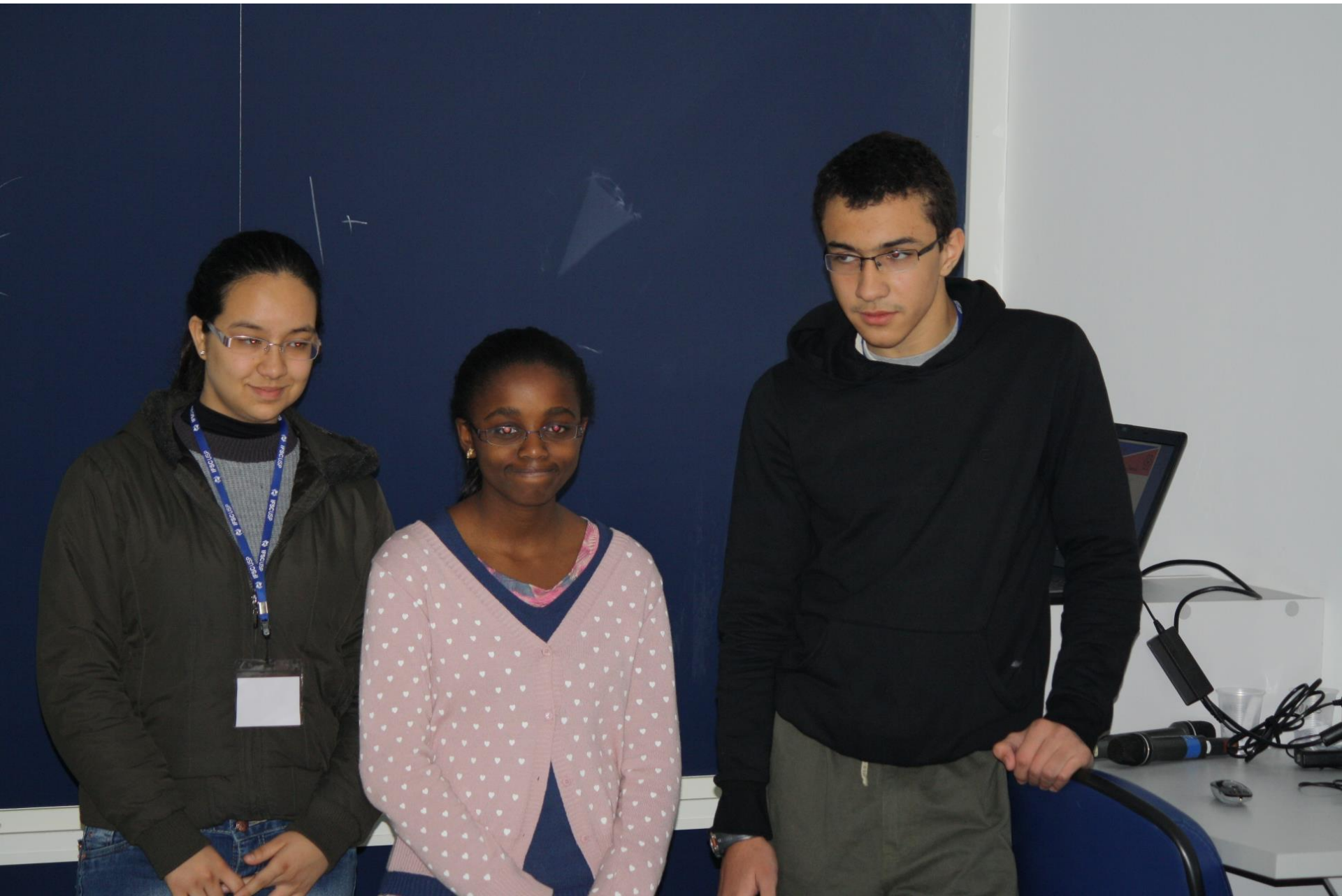
Seminário – 1 Experimento em Eletromagnetismo