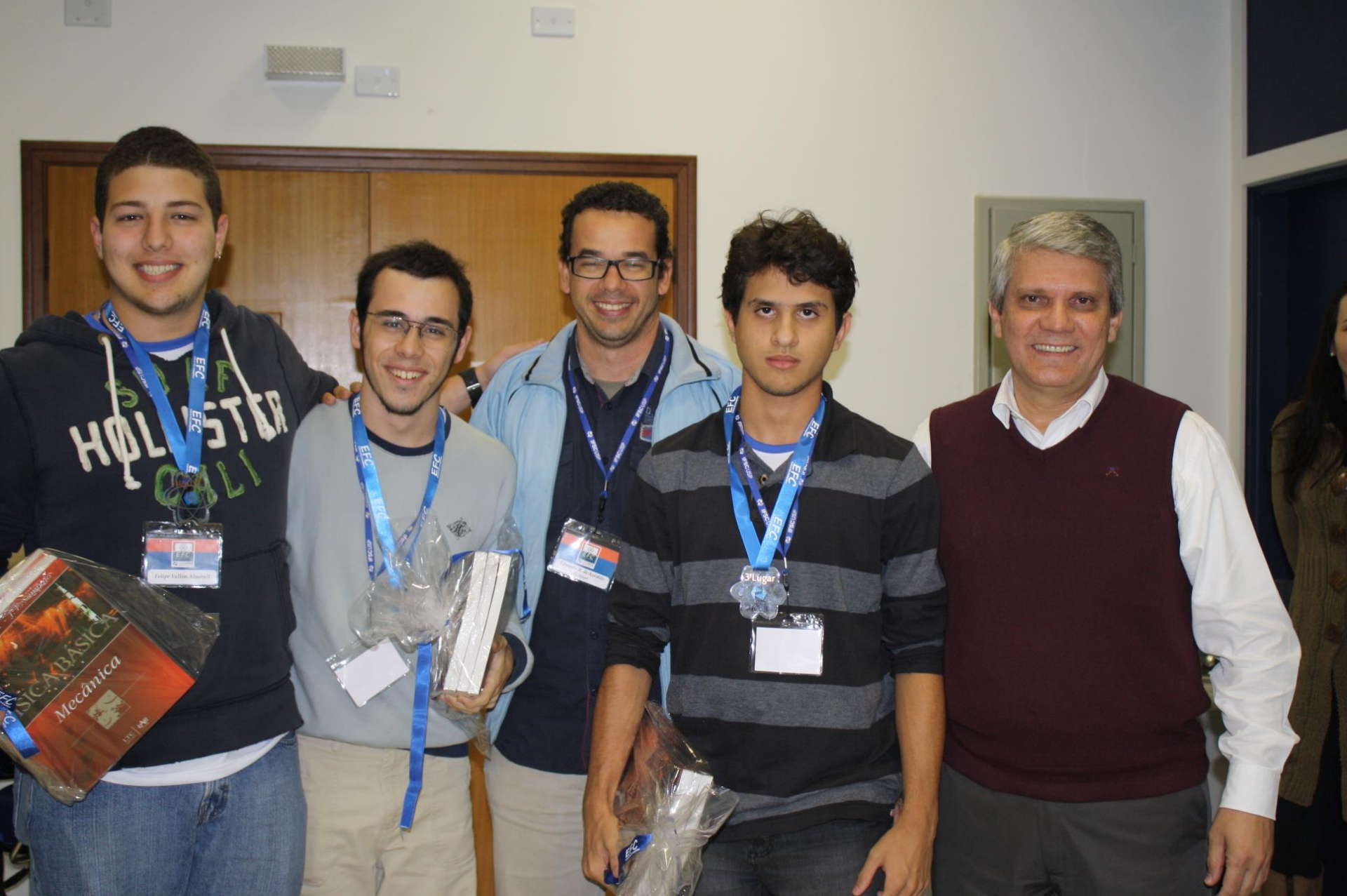
3º Melhor Grupo EFC 2013