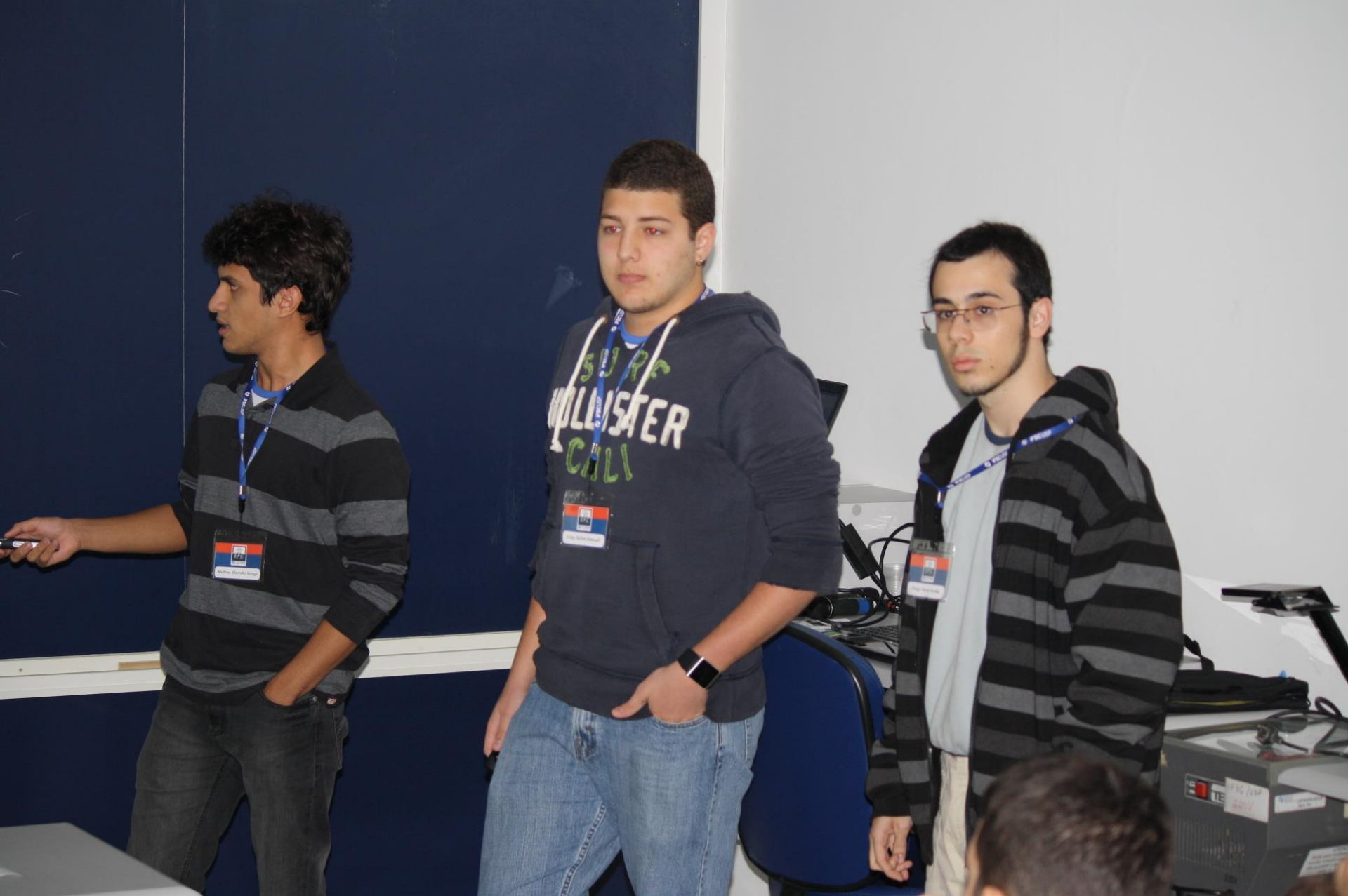
Seminário – 2 Experimento de Millikan