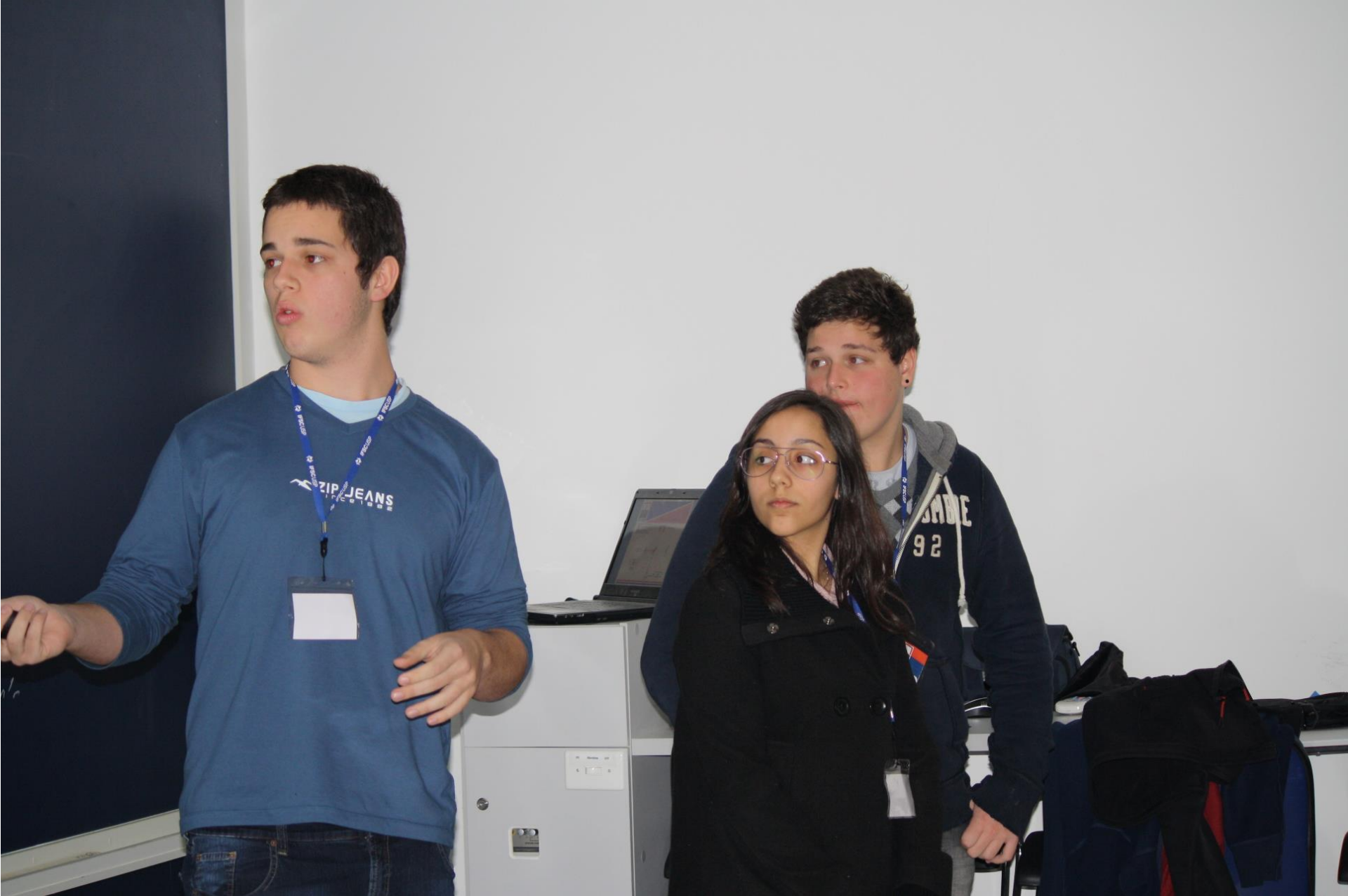
Seminário – 9 Interferômetro de Michelson-Morley