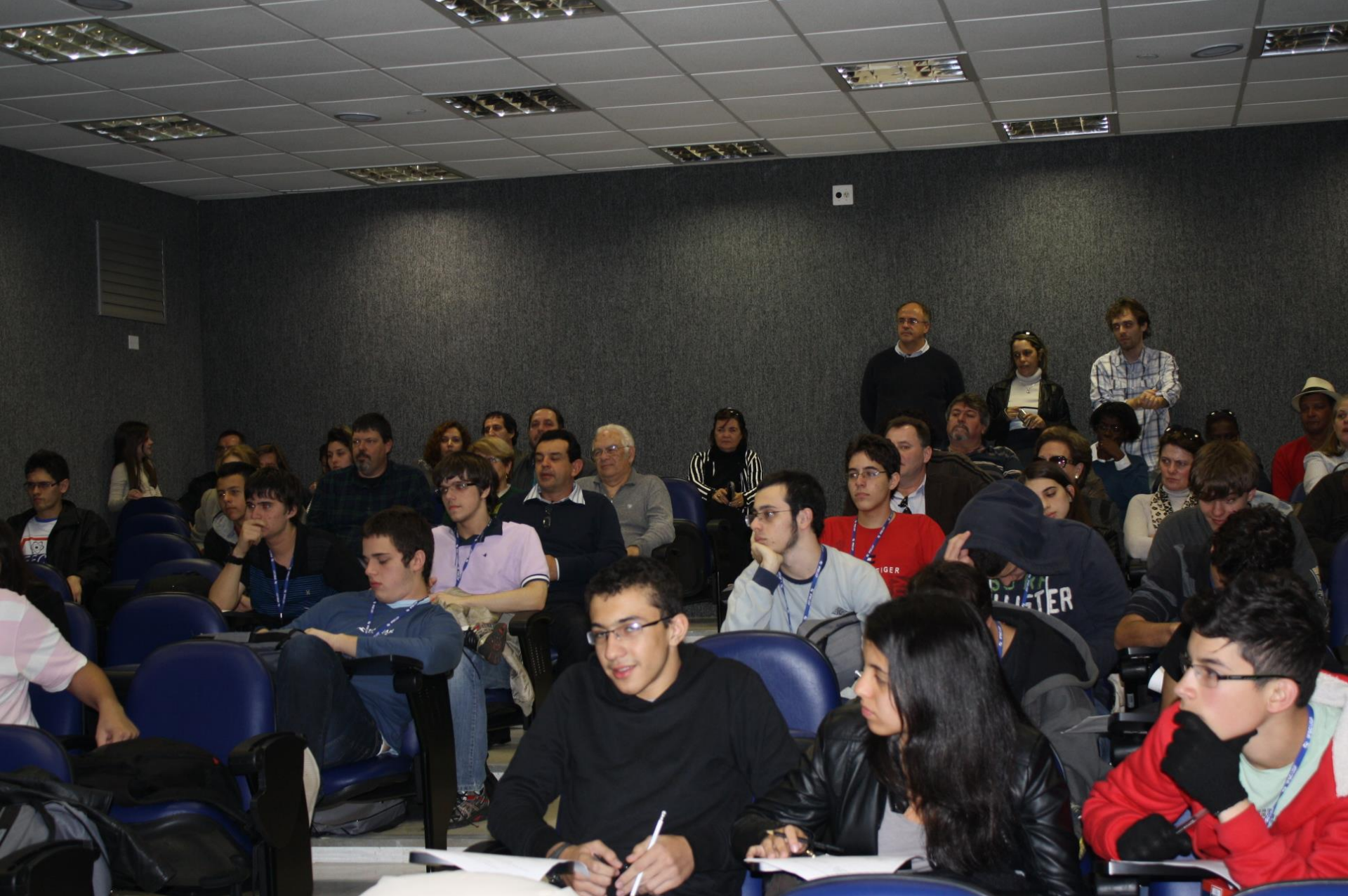
Anfiteatro Azul – LEF-IFSC Vista parcial da plateia - 2