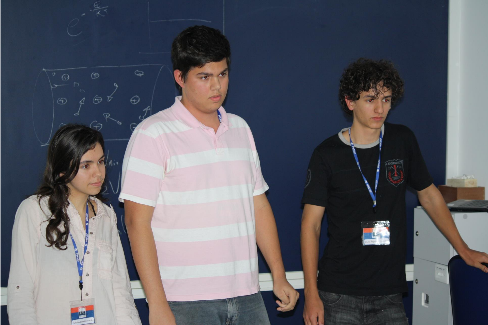
Seminário – 8 Velocidade da Luz