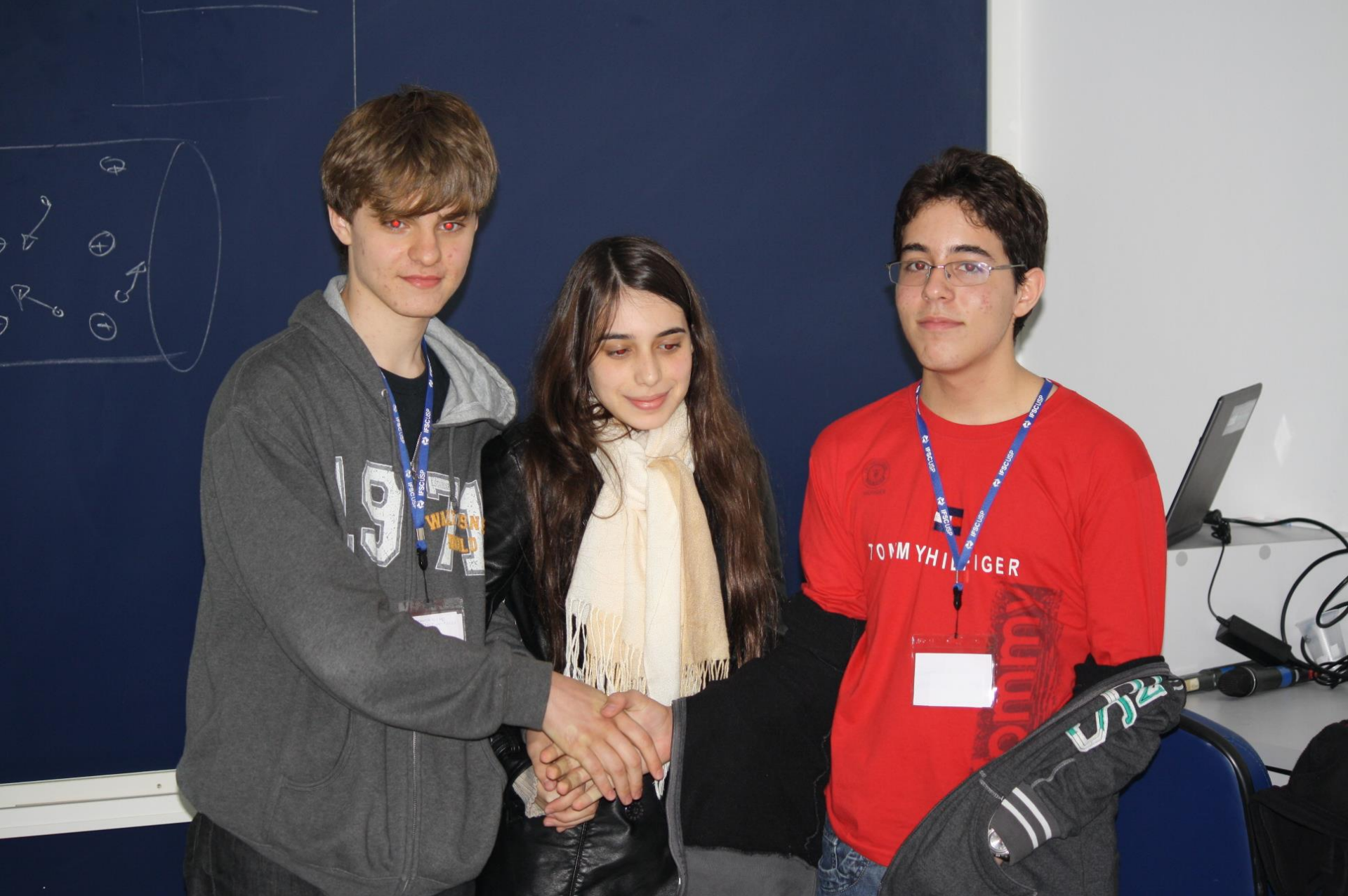
Seminário – 6 Radiação de corpo negro e experimentos com LED