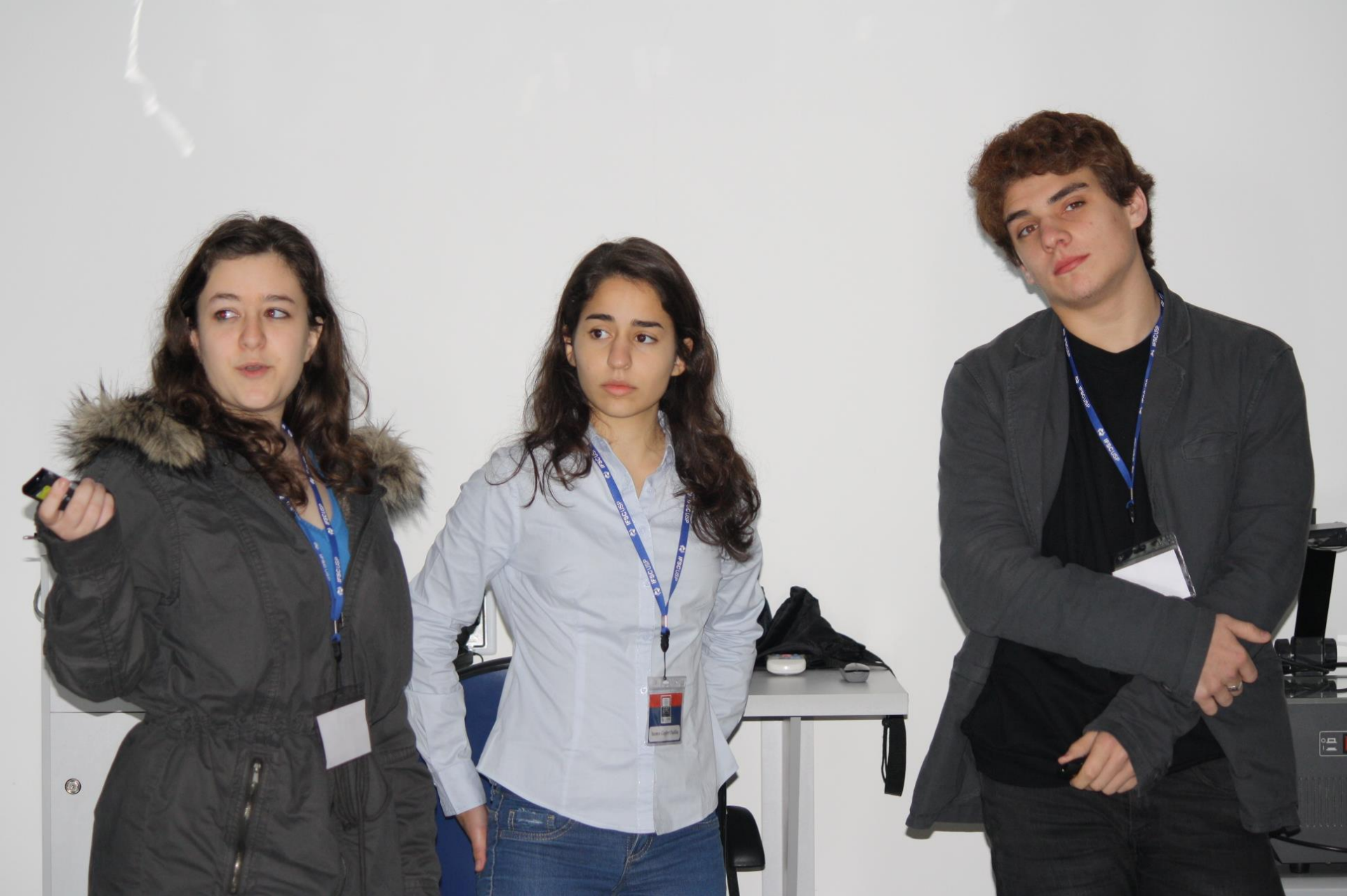
Seminário – 3 Difração de Elétrons