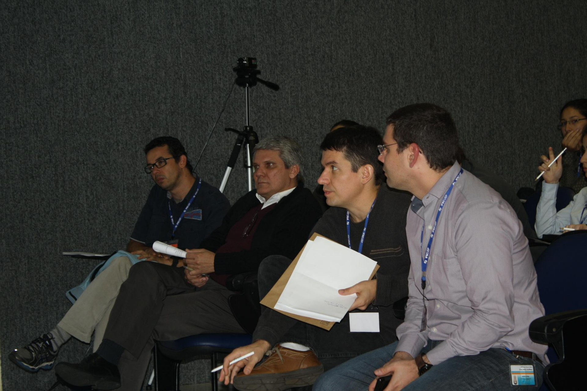
Avaliadores e professores coordenadores da EFC