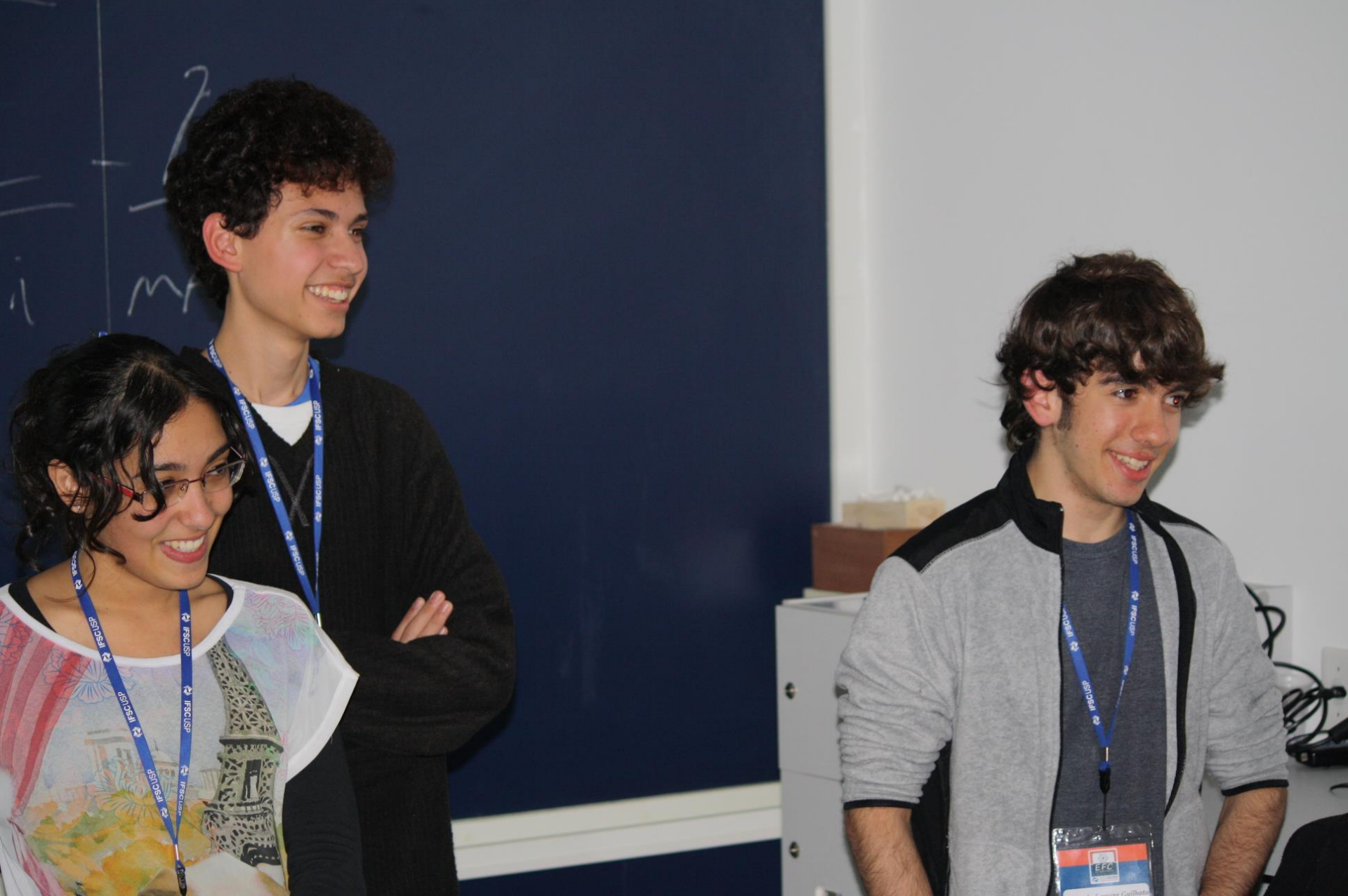
Seminário – 10 Espectroscopia óptica